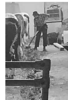
Allevatore. All'interno della sua stalla ripreso in un momento in cui provvede alla pulizia delle lettiere.

Lontano dai grandi centri urbani ma tanto vicino a Dio e agli uomini, tra le vette appenniniche.