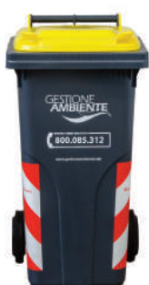
CARTA E CARTONE