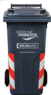
SECCO NON RICICLABILE