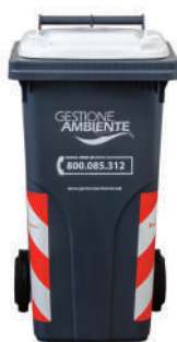
IMBALLAGGI IN PLASTICA E LATTINE